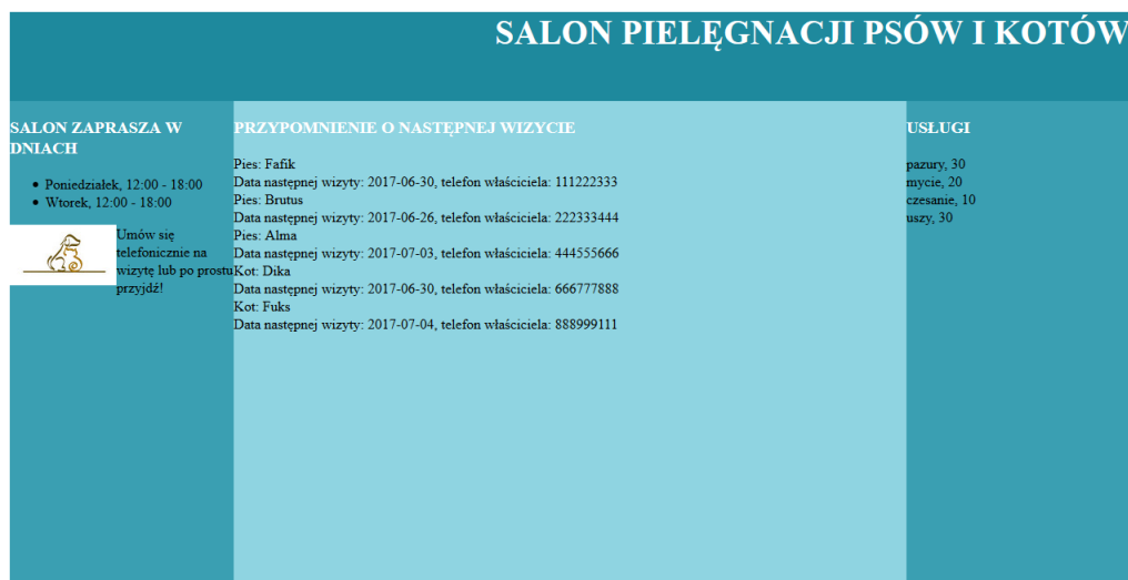
Obraz 2. Witryna internetowa